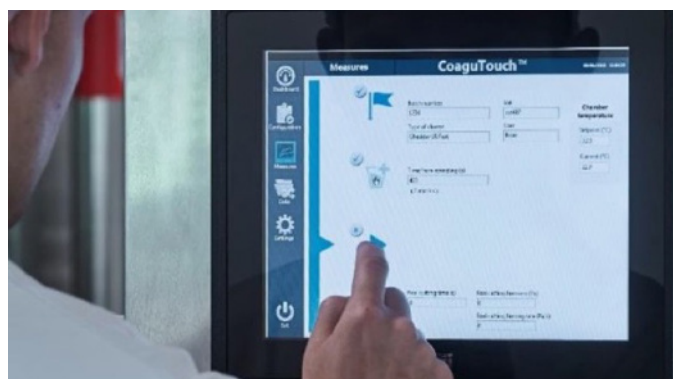
Рис. 4. Прибор непрерывного действия «CoaguTouch™» для определения момента разрезки коагулированного сгустка

Так как фактическая массовая доля влаги (м.д.в.) в выработках отличается от целевой, необходимо посчитать