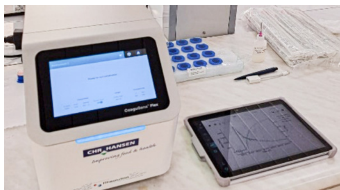
Рис. 3. Прибор «CoaguSens Flex™» для определения момента разрезки коагулированного сгустка в автоматическом режиме

необходимых дозировок в IMCU на единицу нормализованной смеси. IMCU — международная молокосвертывающая единица (International Milk-Clotting Unit).