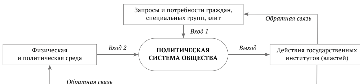
Рис. 1. Функционирование политической системы в теоретическом представлении Д. Истона

Функция латентности , или воспроизводства образца, направлена на поддержание в обществе общепризнанных норм и ценностей культурной системы, на передачу ценностей последующим поколениям. Эта функция включает в себя также деятельность по наложению санкций на тех, кто нарушает признанные культурные нормы и не поддерживает установленные в обществе ценности [14]. Анализируемое Т. Парсонсом социетальное сообщество характеризуется легитимной властью, которая поддерживается индивидами и группами.