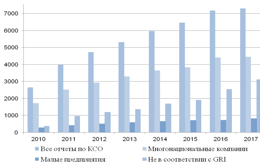
Рис. 2. Количество отчетов КСО по данным Global Reporting Initiative Fig. 2. Number of corporate social responsibility reports according to Global Reporting Initiative