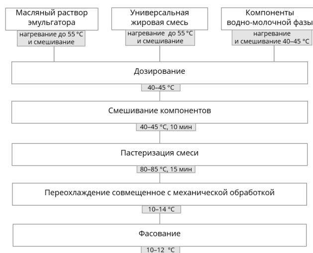
Рисунок 1. Схема получения модельных спредов

Нами получены эмульсии концентрацией 61 % с использованием природных и синтезированных эмульгаторов и их смесей и модельные спреды с их использованием. Технологические этапы производства модельных спредов представлены на рисунке 2.