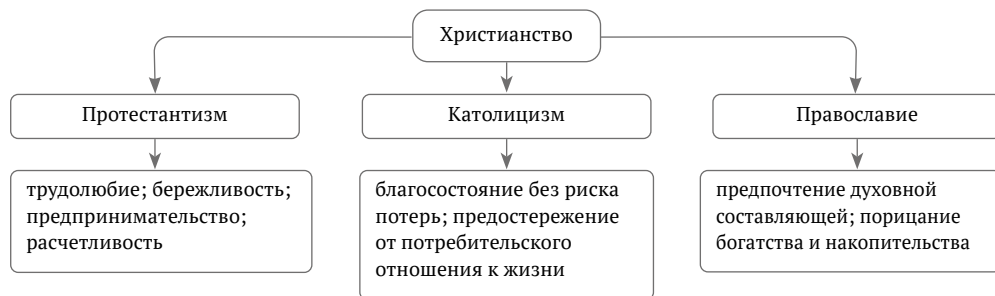
Рис. 2. Основные ценности религиозной этики христианства: экономический аспект Fig. 2. The main values of religious ethics of Christianity: economic aspect

Как следствие, нормы исламской религиозной этики способствуют укреплению социальной справедливости и сплоченности, формируют такие ценности, как взаимопомощь, усердие, ответственность перед обществом.