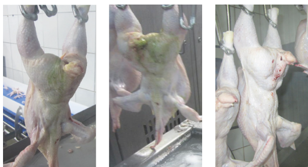
Рисунок 3. Состояние тушек после потрошения

Валидацию процесса заморозки и временного хранения продукции проводили после успешной проверки работы оборудования по следующим видам