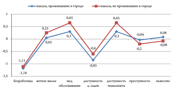
Рис. 3. Оценка условий жизни по степени наиболее актуальных проблем